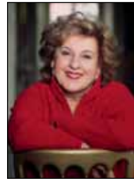
Marjana Lipovšek , Mezzosopran

Marjana Lipovšek wurde in Ljubljana/Slowenien geboren. Nach ihrem Studium in ihrer Heimatstadt, in Graz und Wien (Klavier, Musikpädagogik, Gesang) wurde sie direkt an die Wiener Staatsoper verpflichtet. Inzwischen hat sie alle großen Partien ihres Fachs an den großen Häusern in der ganzen Welt gesungen. Neben ihrer Operntätigkeit ist Marjana Lipovšek weltweit auch als Konzertsängerin gefragt. Ihr Repertoire reicht von Bach bis zu zeitgenössischer Musik. Marjana Lipovšek ist Wiener und Bayerische Kammersängerin.